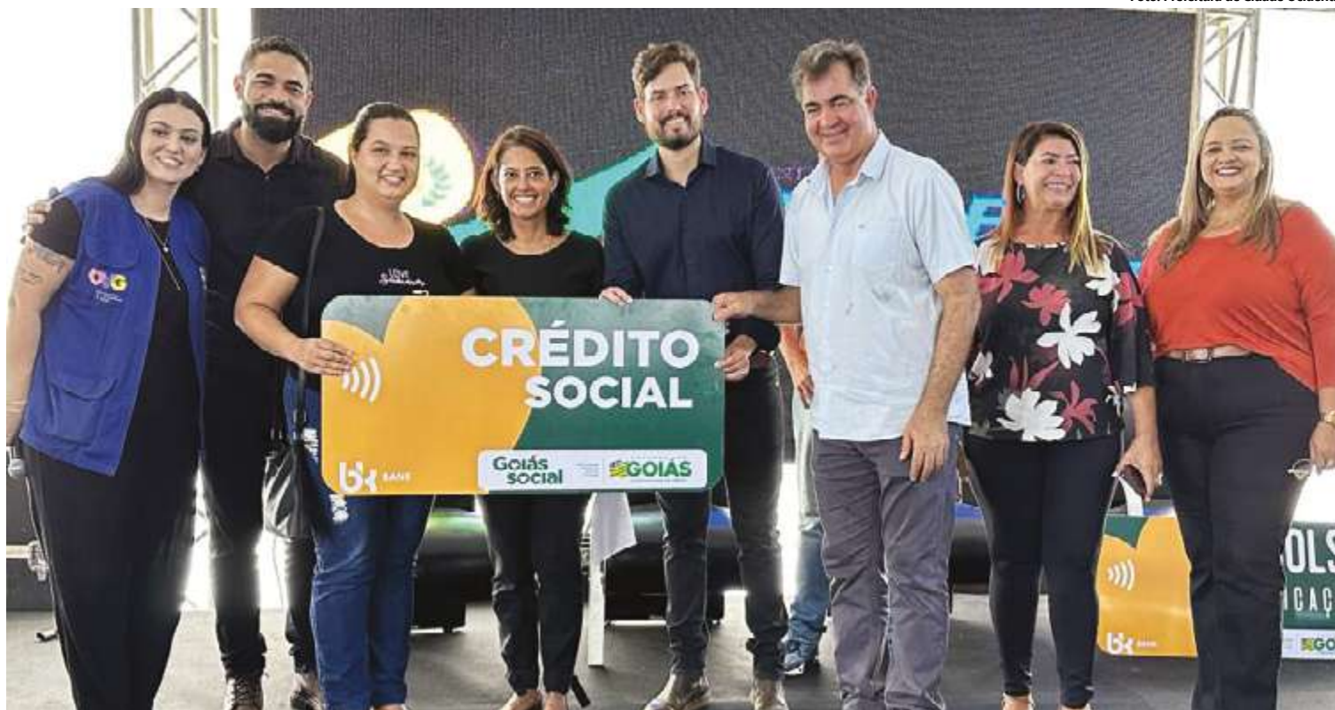
Foram mais de 2300 atendimentos e quase R$ 300 mil de investimento em bolsa qualificação e crédito