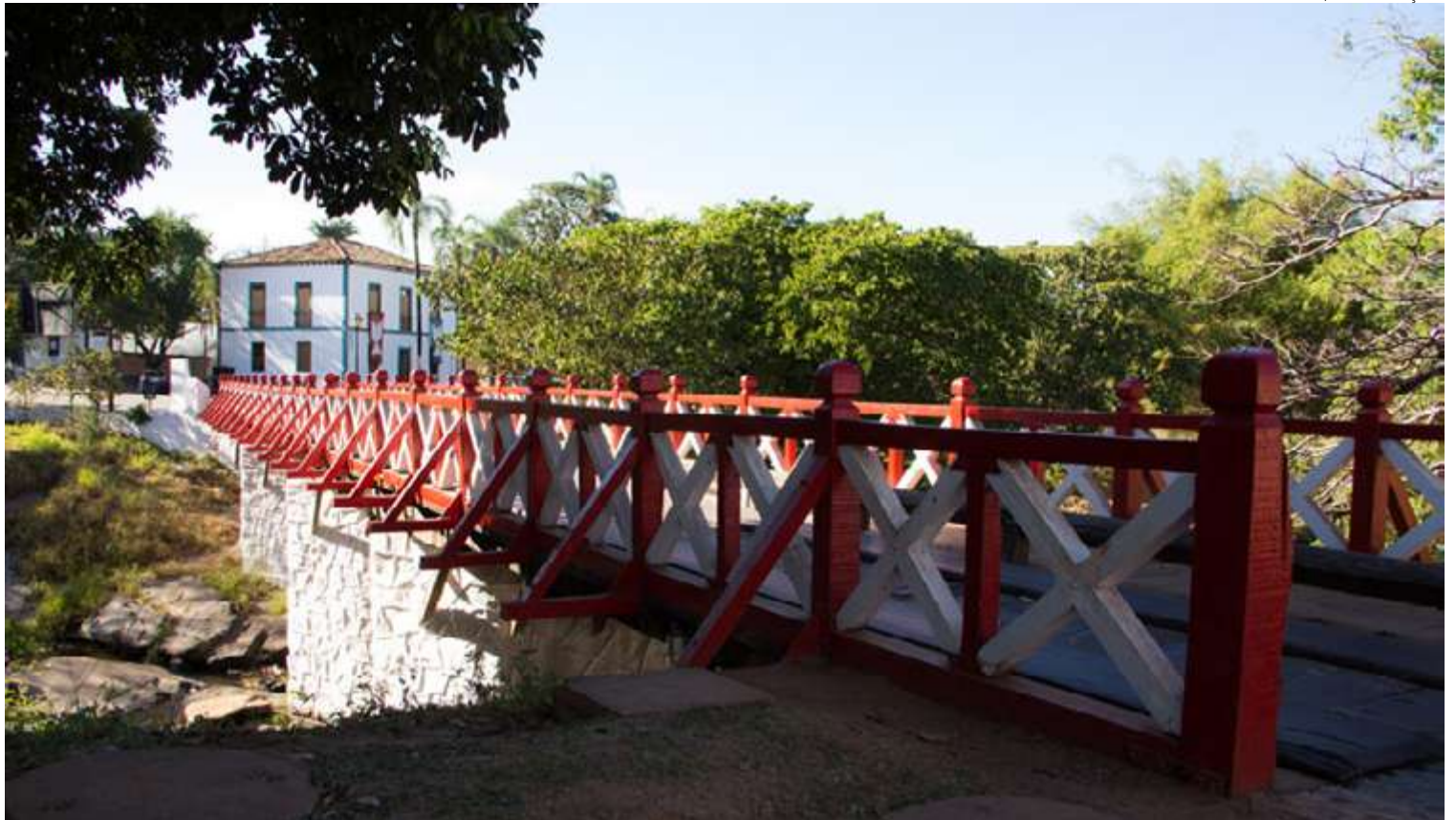
Sombra e água fresca: evento toma conta do Centro Histórico do município goiano