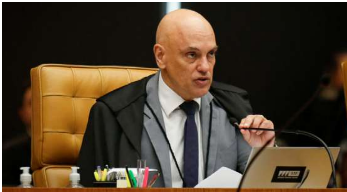
Alexandre de Moraes: combate à utilização da inteligência artificial com fins de desinformação

Segundo Moraes, em seminário promovido pela Fundação Getúlio Vargas (FGV), no Rio de Janeiro, o uso da IA no contexto político pode ampliar o alcance e o convencimento de eleitores por meio da desinformação. Por isso, a aplicação de punições, como cassação de candidaturas e de mandatos, seria importante para combater o problema nos próximos processos eleitorais. O ministro ainda voltou a dizer que as big techs – que administram as plataformas de redes sociais – devem ser submetidas a regulamentação.