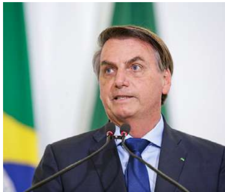
Jair Bolsonaro: devolução de objetos que recebeu em agendas oficial

Já a pistola e o fuzil que o ex-presidente recebeu de presente do regime dos Emirados Árabes, segundo a proposta feita pela área técnica do TCU, devem ser entregues pela Polícia Federal (PF) diretamente à Presidência.