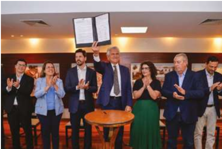
Governador Ronaldo Caiado durante assinatura do pacto pelo desmatamento ilegal zero em Goiás