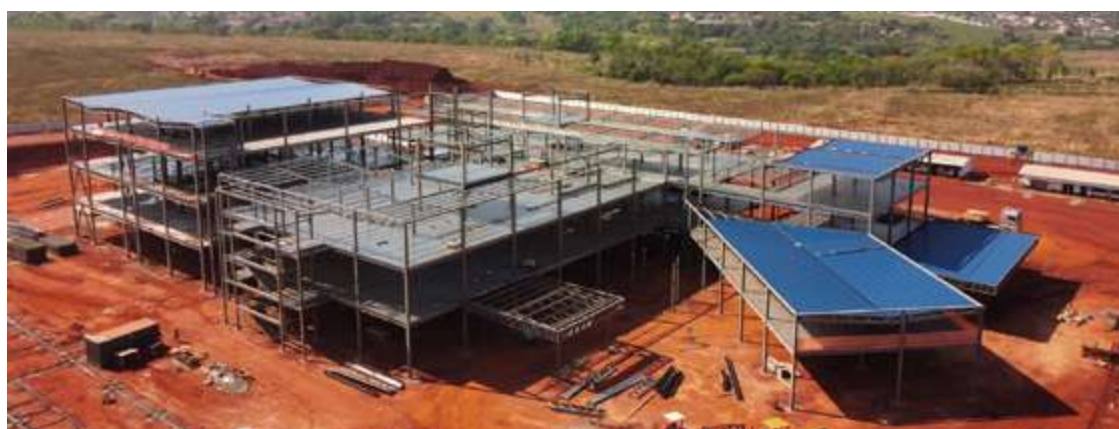
Governo de Goiás informa que mais de 40% dos serviços já estão concluídos

O governador, junto com a primeira-dama Gracinha Caiado, lidera uma mobilização em defesa do projeto, contando com a participação de parlamentares, prefeitos, artistas e outros apoiadores. Na última semana, diversos artistas do primeiro time da música sertaneja conheceram o local e comemoraram o desenvolvimento das obras.