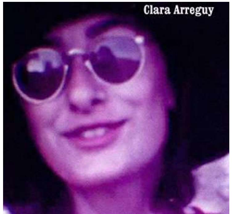
Capa do romance “1974”

e jornalista publicou quase três dezenas de livros. Vai do romance à biografia, das crônicas aos contos, dos livros infantis aos textos jornalísticos - eu sei, este último não possui nenhum compromisso com a forma, mas talvez você mude de ideia ao ler “A História da Mulher Silenciada pelo Sobrinho com um Rodo na Garganta”, reportagem assinada pela escritora-jornalista no “Metrópoles”. Há um atrativo verniz literário na maneira como os fatos são apresentados ao leitor.