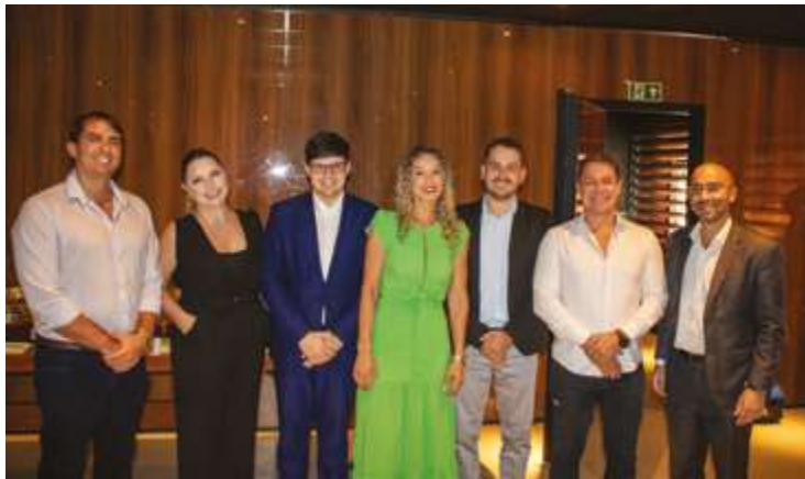
Representantes das empresas 1Doc e Repremig, apoiadores do evento