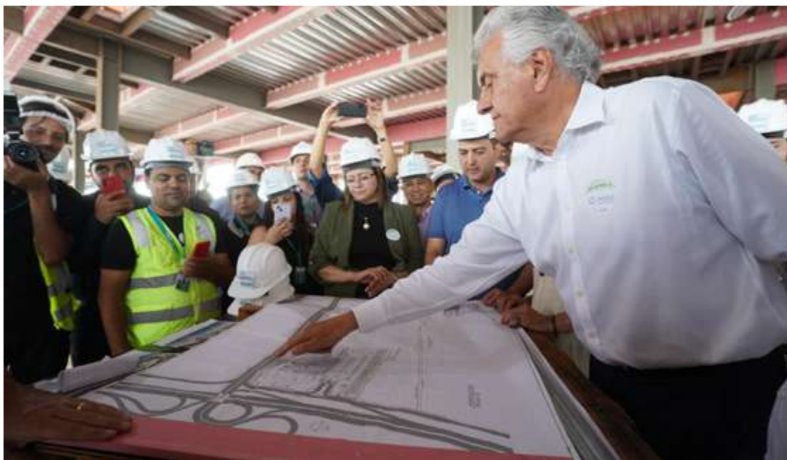
Governador Ronaldo Caiado apresenta obras do Cora para comunidade política: “Em 20 meses vamos ter este hospital pronto, uma obra 100% pública”

Nesta fase, destinada ao atendimento de crianças e adolescentes, o investimento será de R$ 180 milhões. Caiado ressaltou os padrões de excelência