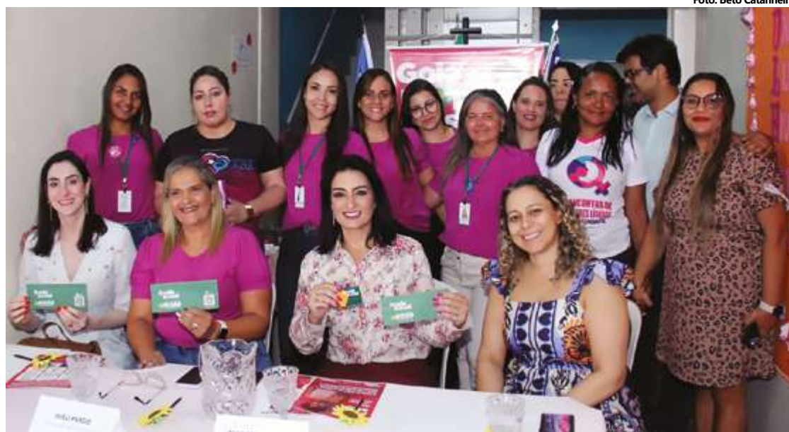
A entrega aconteceu na última quarta-feira (29).