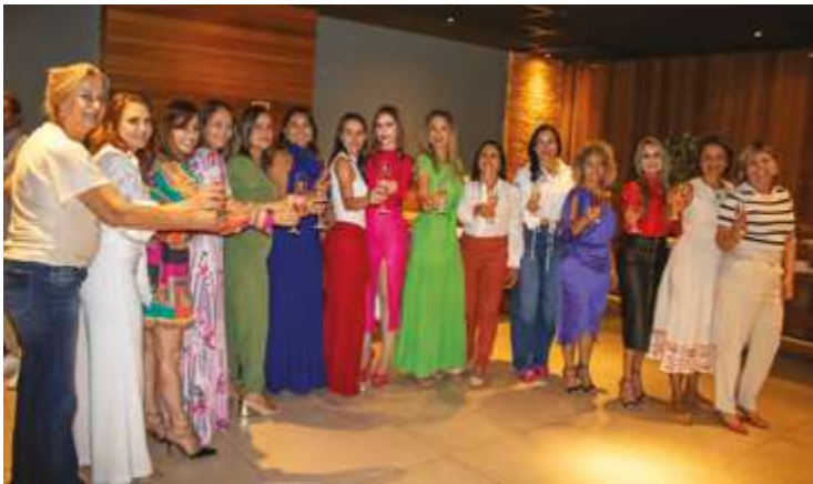
Brinde especial das Primeiras Damas e autoridades femininas