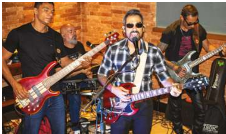
A Banda de Rock Alternativo CF 36 animou a confraternização